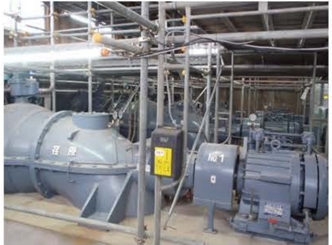
現在稼働中のポンプは、雨に濡れないように仮の屋根で覆われています