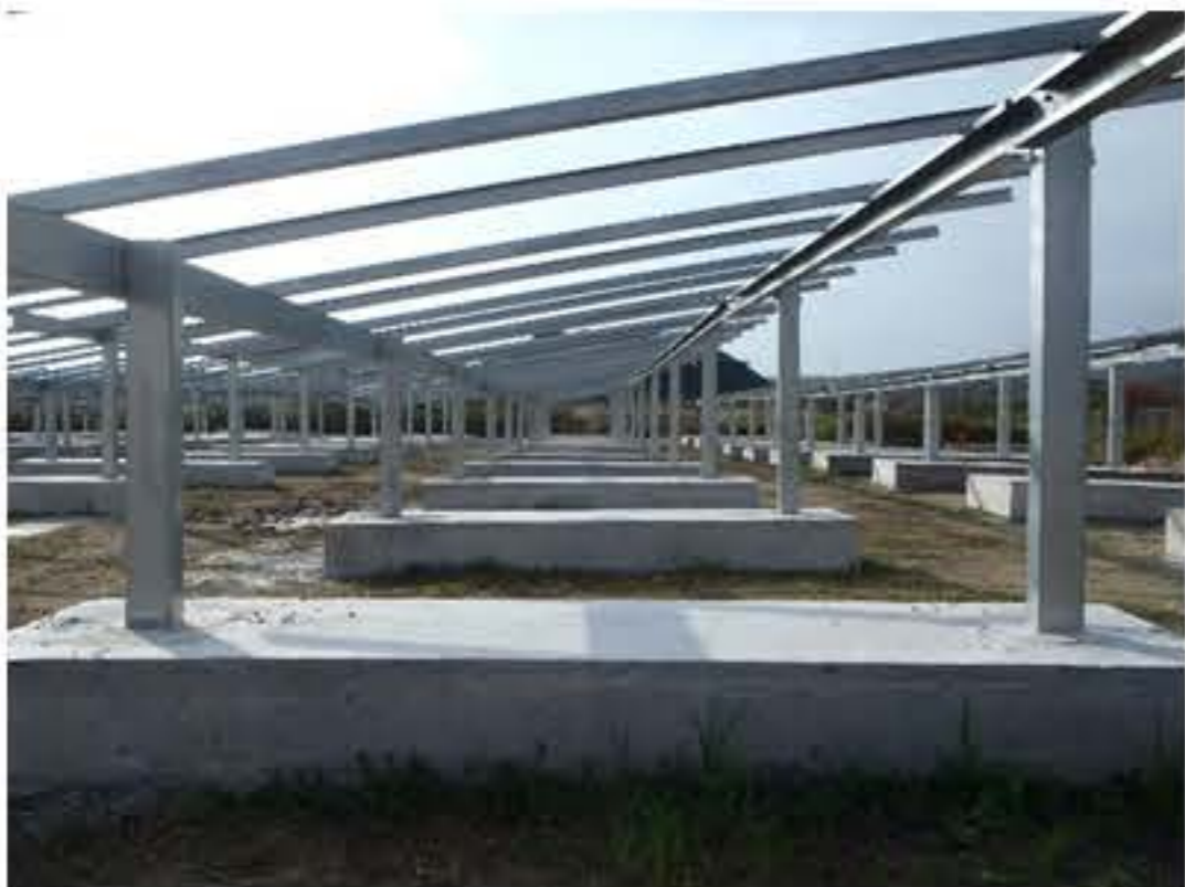
太陽光パネル架台を下側から見た状況です