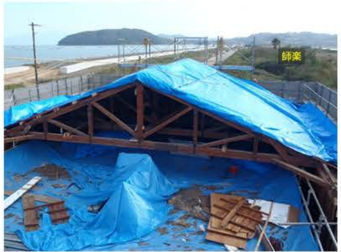
木造の屋根を解体している状況です