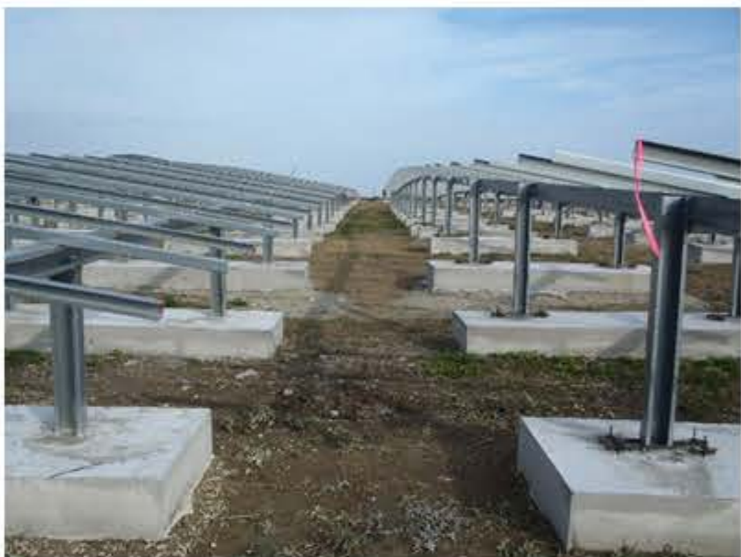
太陽光パネル架台は、地盤勾配に合わせて組立られています