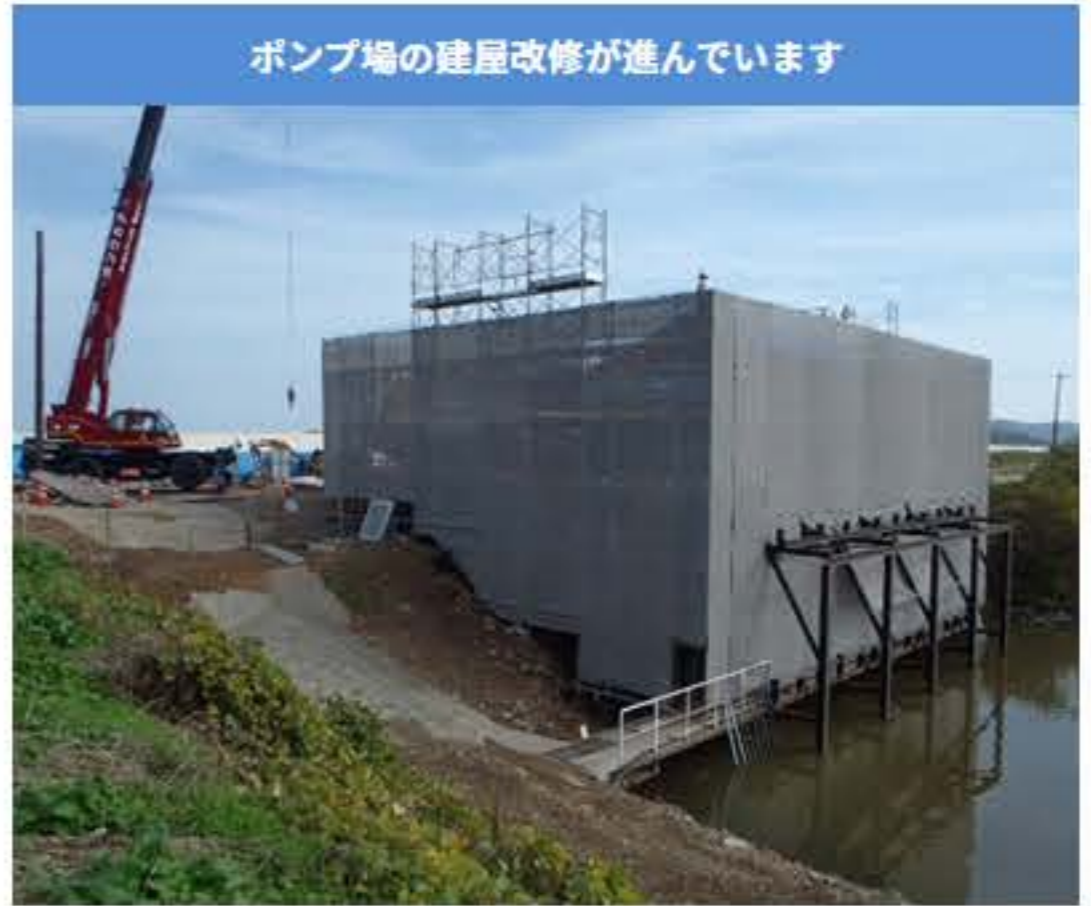
老朽化したポンプ場(所有：瀬戸内市)を補強しています。ポンプ室には塩田跡地の水位の調節のための排水ポンプが設置されています。