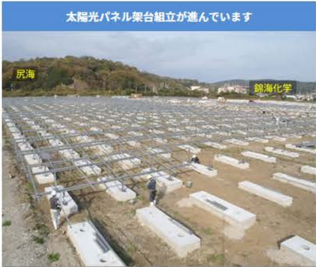
コンクリート基礎杭の上に鋼製の太陽光パネル架台を固定します