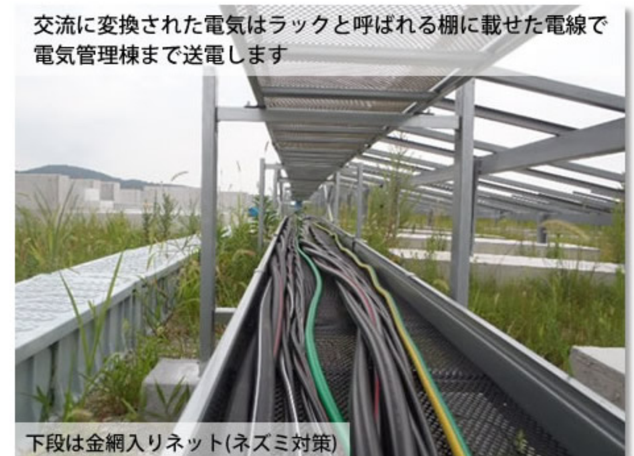
⑦ パワーステーションからの配線