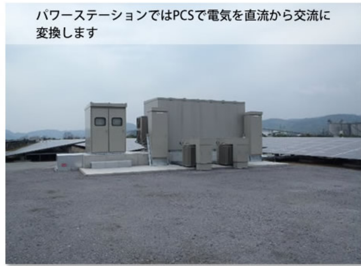
⑥ パワーステーション(写真は他の現場例です)