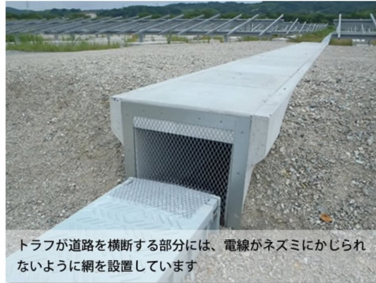
④ トラフの道路横断部分