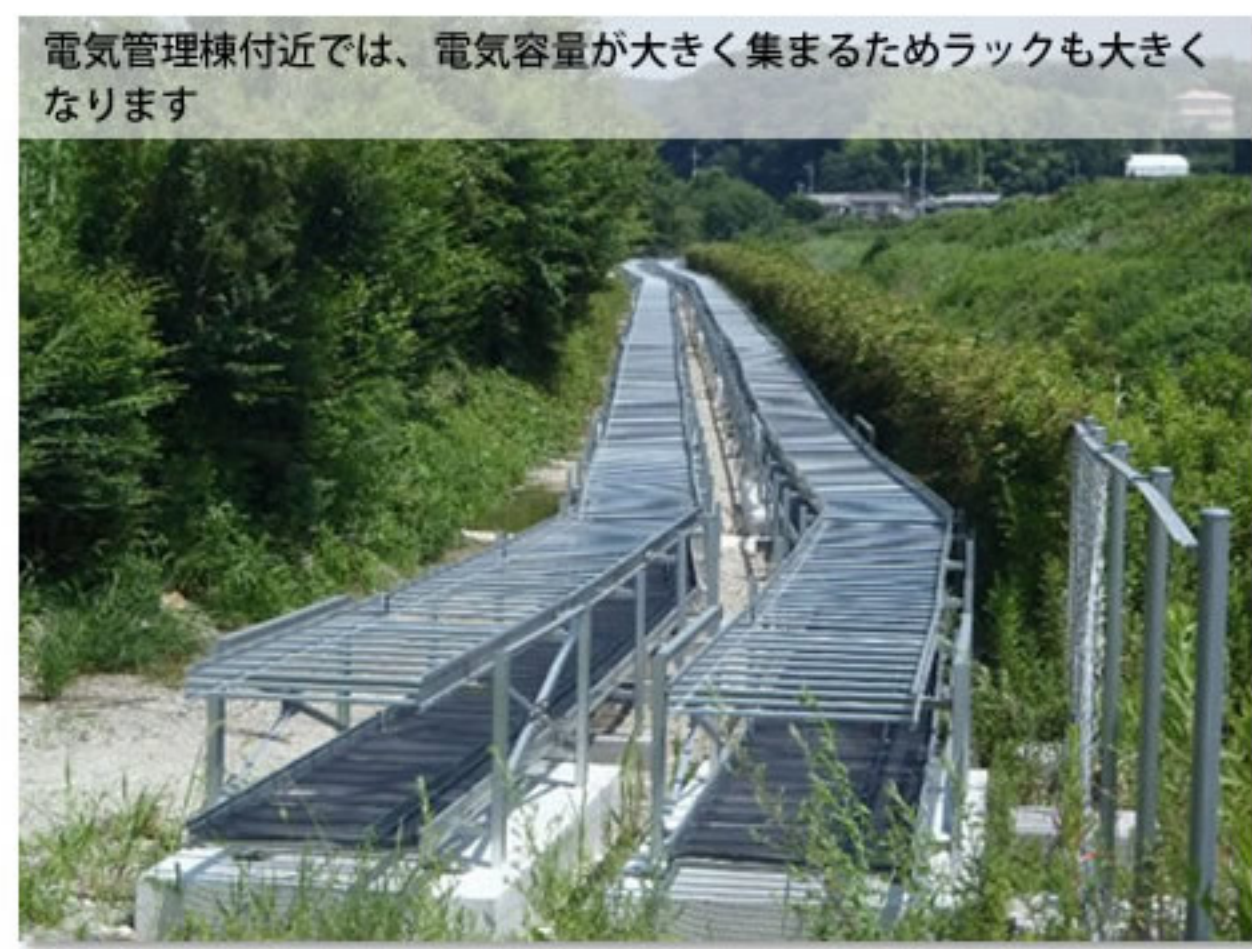
⑩ 電気管理棟付近のラック