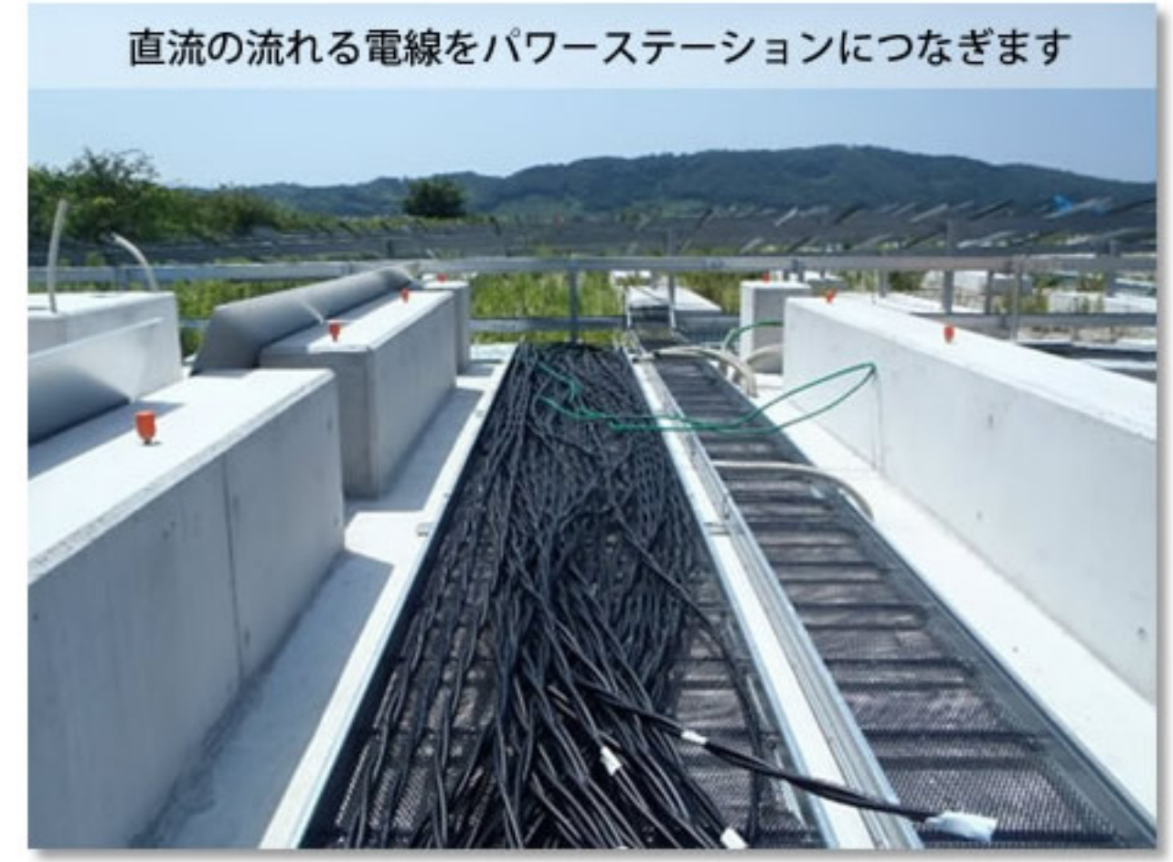
⑤ パワーステーション