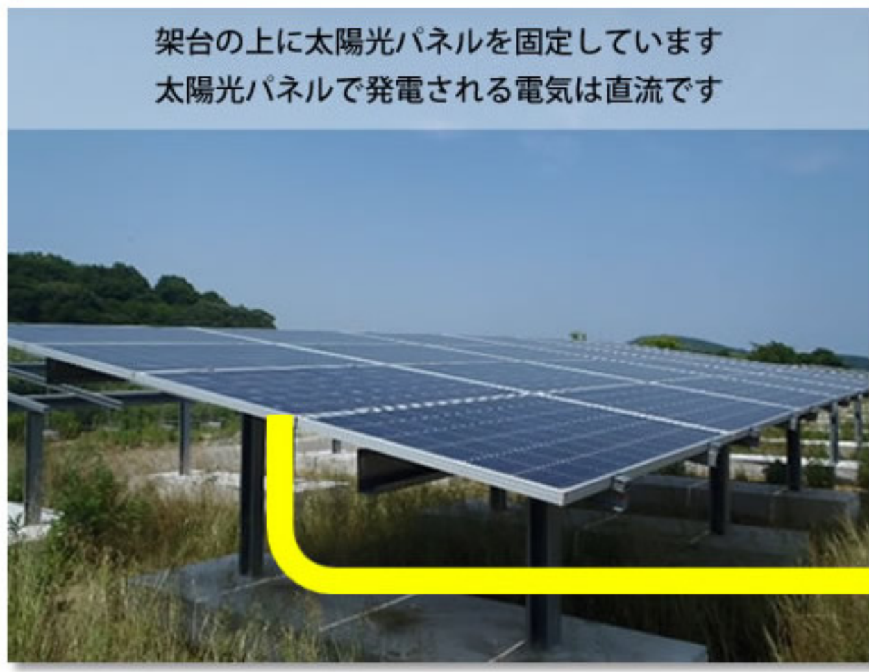
① 試験的に組み立てた太陽光パネル