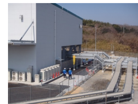
太陽光パネルで発電した電気の取り込み部