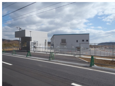
県道からの出入り口